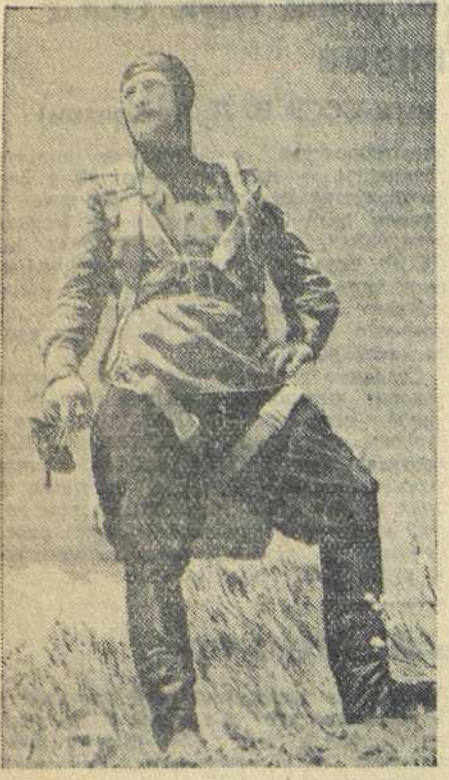
ДЕЯТЕЛЬНАЯ АРМИЯ. Герой Советского Союза гвардии лейтенант Александр Покровский был в самолете противника.